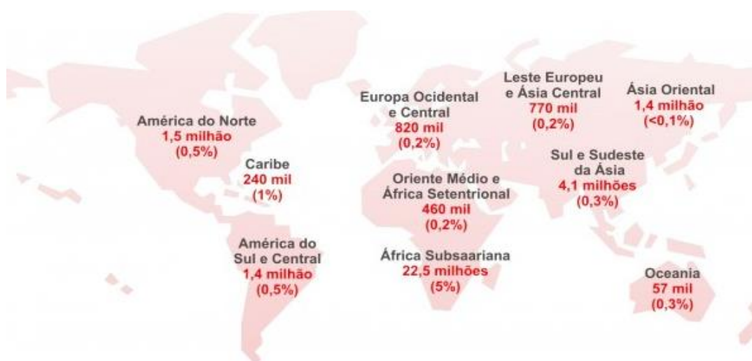
Imagem 01: o número de casos da AIDS no mundo