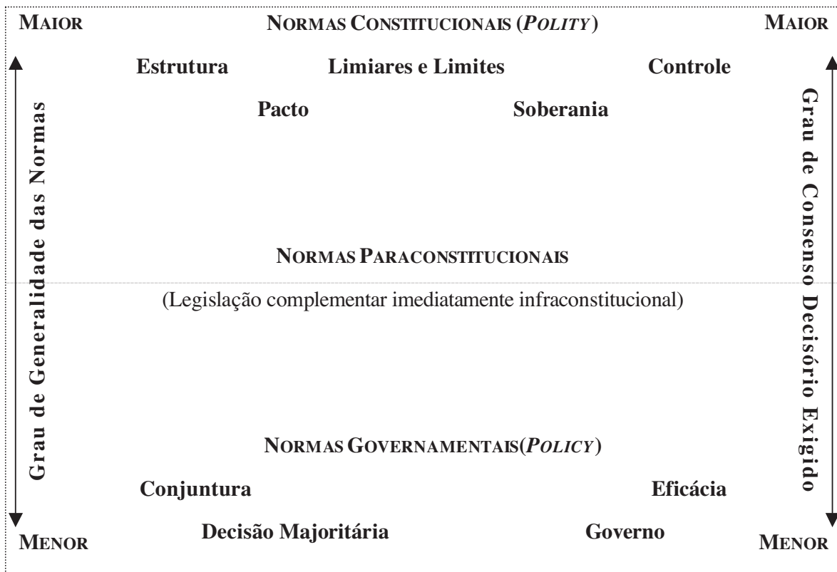
Figura 1 Representação Sintética da Hierarquia Decisória

Dada a função estruturante da polity , as normas constitucionais têm caráter soberano, razão pela qual não estão em princípio sujeitas à discussão democrática cotidiana, à qual balizam, resguardando direitos fundamentais e assegurando que a politics transcorra segundo parâmetros previsíveis e estáveis. Normativamente, correspondem a um momento inaugural, no qual se fundaria a polity e se iniciaria o jogo político (Ackerman, 1988). Em virtude disso, são protegidas contra modificações freqüentes, sendo as regras para sua alteração bem mais exigentes do que as necessárias para alterar